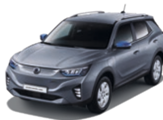
Platinum Gray (ADA)*