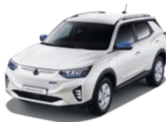
Grand White (WAA)