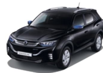
Space Black (LAK)*