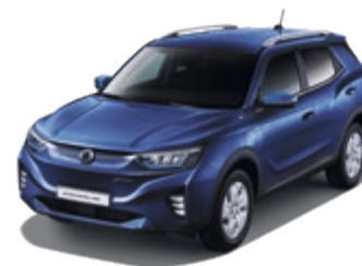
Dandy Blue (BAS)*